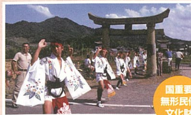
宇土手の荒踊(うとでのあらおどり)

759年創建、1959年に1200年大祭を行ったとのこと。境内には天照皇太神宮、天満宮、稲荷大明神が祀られている。