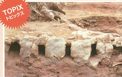
① 甕屋窯跡(かめやかまあと)

地区名「甕屋」の由来となった窯。17世紀半ばから18世紀まで約150年に渡って生産を行っており、2基の登窯の存在が確認されている。日常的に使われた陶器が大量に焼かれていた。中には「花文」をつけた高級な壺や甕も焼かれていた。