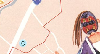
② Café亜羅琲珈(アラビカ)

営業時間 / 10:00~19:00 定休日 / 元旦 TEL.0954-23-2908