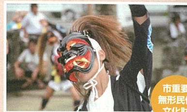
袴野面浮立(はかまのめんぶりゅう)

1321年干ばつに見舞われた際、塚崎領主の後藤光明が祈禱を行った後、雨が降ってきた事から、この地区では風雨の神として尊崇される。