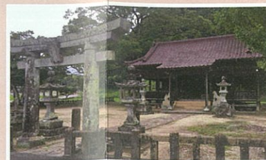
③ 正一位神社(しょういちじんじや)

五穀豊穡・家内安全・村中平和を祈念し、毎年秋の彼岸の中日に貴船神社に奉納されている。