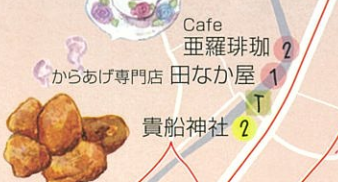
① からあげ専門店 田なか屋

創業33年の歴史を持つからあげ専門店。おすすめは「骨付きからあげ」。地元でも大人気!