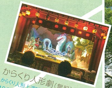
からくり人形劇(無料) からくり人形上演時間 10:00~、12:00~、15:00~