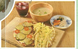
A 土雑貨の店&カフェ つちのや

ピカピカ だろだろ作り体験 お店があらかじめ用意したおだんごをピカピカに仕上げる作業を体験できる。大人も子供も土に触れて楽しもう。 料金 / 500円