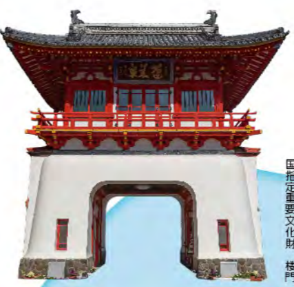
国指定重要文化財 楼門

まるで竜宮城のような鮮やかな朱塗りの楼門をシンボルに持つ武雄温泉は1300年の歴史を誇る名湯。さまざまな成分が程よく入った弱アルカリ単純泉で、透明で柔らかな湯ざわりが特徴です。湯上りの保温性に優れ、肌がなめらかに、しっとり感じられることから、「美人の湯」とも呼ばれています。楼門をくぐり抜けた先にある元湯は、明治9年に建築され、現存する木造建築共同浴場としては日本最古のもの。約45℃の「あつ湯」と約43℃の「ぬる湯」2種類の湯船を持ち、ゆったりとした雰囲気の中にレトロな浪漫が漂う温泉に浸れば、旅の疲れも癒されます。