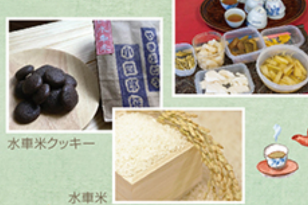
水車米クッキー 水車米

営業時間 / 9:00~17:00 定休日 / 12/29~1/3 駐車場 / 25台・大型5台(無料)